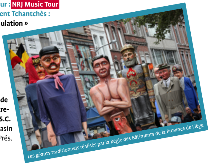
Les géants traditionnels réalisés par la Régie des Bâtiments de la Province de Liège

- Exposition de la Vierge de la République Libre d'Outre-Meuse, offerte par la C.S.C. dans la vitrine du Magasin « Matreli » Chaussée des Prés.